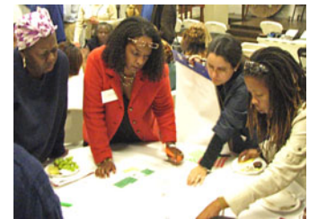
En la foto: Empleados de MBS dirigen varias reuniones de diseño realizadas en el centro comunitario.

También exhortamos a los residentes a participar en una nueva encuesta de Servicios Comunitarios y de Apoyo (CSS, su sigla en inglés) poniéndose en comunicación con el personal de CSS en la oficina de "HOPE VI" situada en el Centro Comunitario "Merline Matthews", localizado en 5200 NW 22 Avenida. Llame al 305-633-2093 para concertar una cita o envíe un correo electrónico a HOPE6CSS@miamidadade.gov