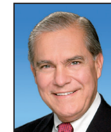
Sen. Javier D. Souto Distrik 10