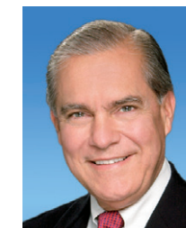
Sen. Javier D. Souto Distrito 10