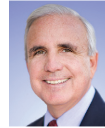
Carlos A. Gimenez Alcalde