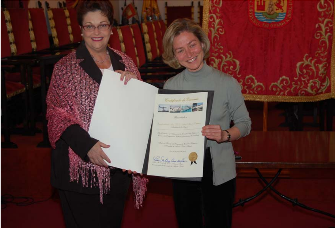
Old friendships renewed, new friendships made: Commissioner Rebeca Sosa enjoys meeting the Mayor of La Laguna, Ana Maria Oramas.