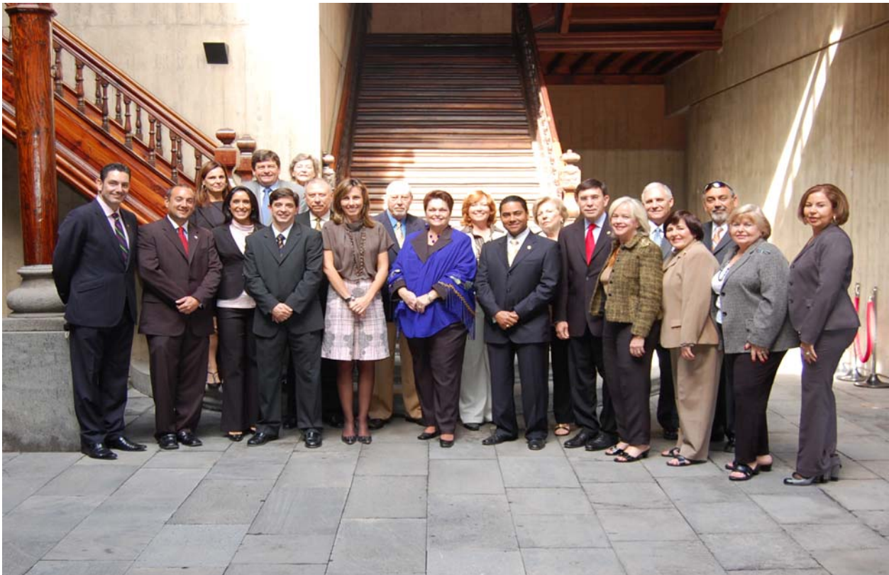
Members of the Miami-Dade County delegation pose with Commissioner Elsa Casas, Commissioner of International Affairs for the Government of the Canary Islands, at the Office of the Presidency of the Canary Islands.

On Wednesday morning, the delegation arrived at The Presidency of the Canary Islands Government, where they met with Ms. Elsa Casas, Commissioner of International Affairs for the Government of the Canary Islands. Commissioner Casas welcomed the delegation to the Canary Islands on behalf of the President, Paulino Rivero Baute, and discussed the importance of the Canary Islands international relations in general, and how important the US, Latin America and the Caribbean are to them specifically. Commissioner Sosa spoke about the rich cultural and historical linkage between the Canary Islands and Miami-Dade County, and how our community is forever linked in many ways to the Spanish island chain. Institutional gifts were then exchanged, and Commissioner Sosa presented a Certificate of Appreciation to Commissioner Casas.