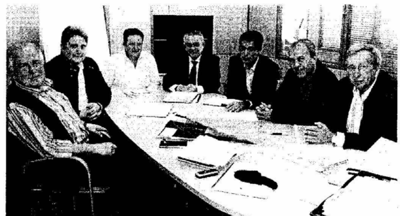
La reunión tuvo lugar ayer en las dependencias de Medio Ambiente en La Laguna.

La Universidad de La Laguna evaluará los condicionantes y