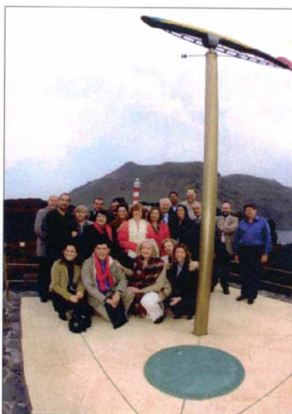
Hosts and visitors at Teno