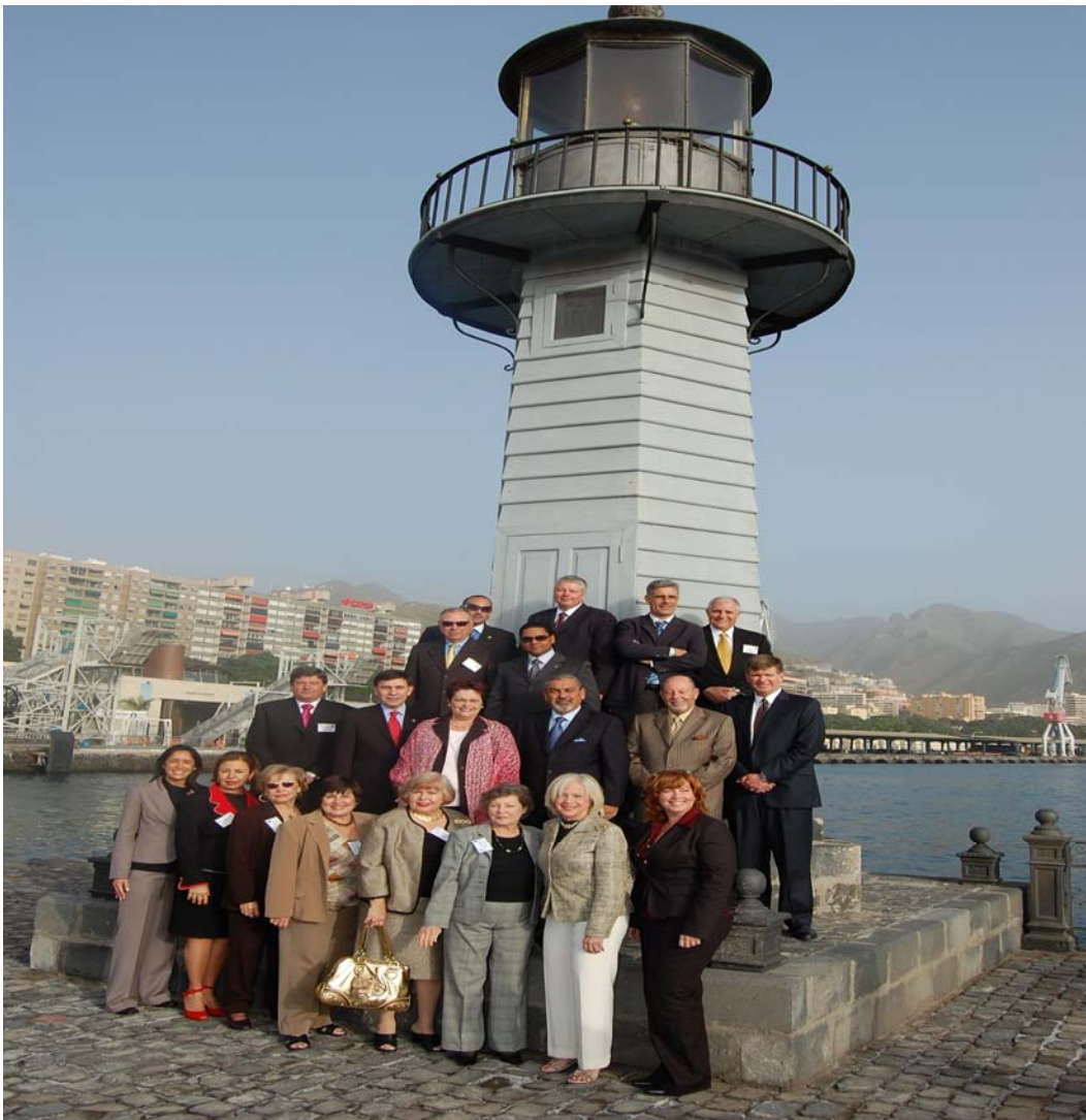
The Miami Dade County delegation visits the Port of Santa Cruz of Tenerife.

Mission delegates were provided with access to Port facilities generally not open to the public so that they could see first hand how the Port is improving its cargo, cruise passenger, security, and service facilities to better serve customers in an increasingly competitive environment.