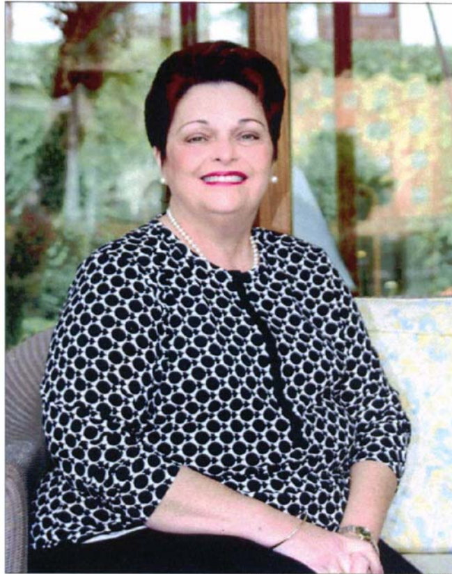
District Commissioner for District Six, Miami-Dade, Florida