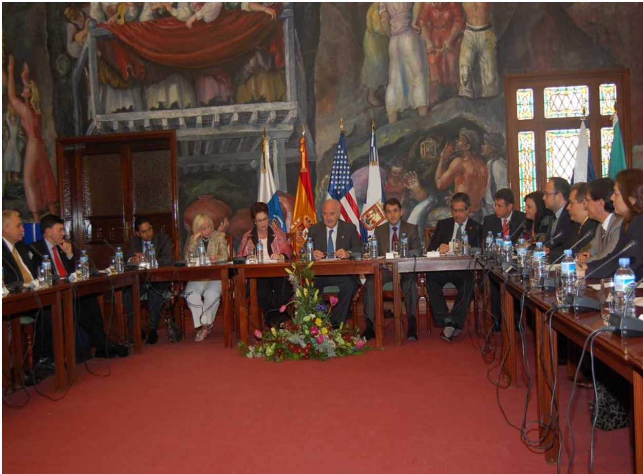
The Miami-Dade County delegation meets with senior officials from the Cabildo of Tenerife.