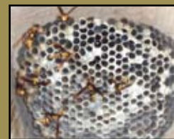
Nido de avispon

Aproximadamente 1/4 de pulgada de longitud.