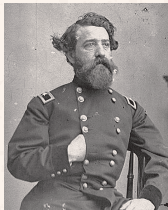
▲ John M. Brannan, vè 1865