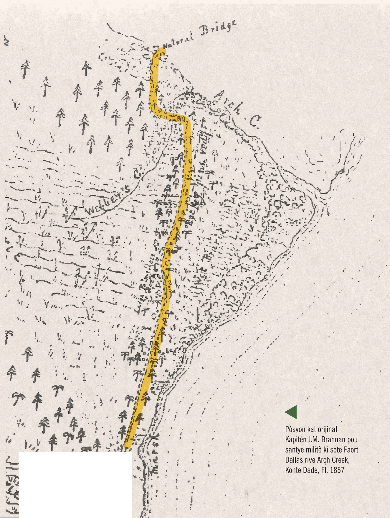
▲ Pòsyon kat orijinal Kapitèn J.M. Brannan pou santye militè ki sote Faort Dallas rive Arch Creek, Konte Dade, Fl. 1857

Santye a te konekte yon pòsyon wout an wòch ki mennen Fort Capron, senk mil nan nò Fort Pierce. An 1892, li te vin yon pati premye wout Konte a ki pase sou pon natirèl la ak Arch Creek . Yo te ba li lòt non Dixie Highway an 1915.