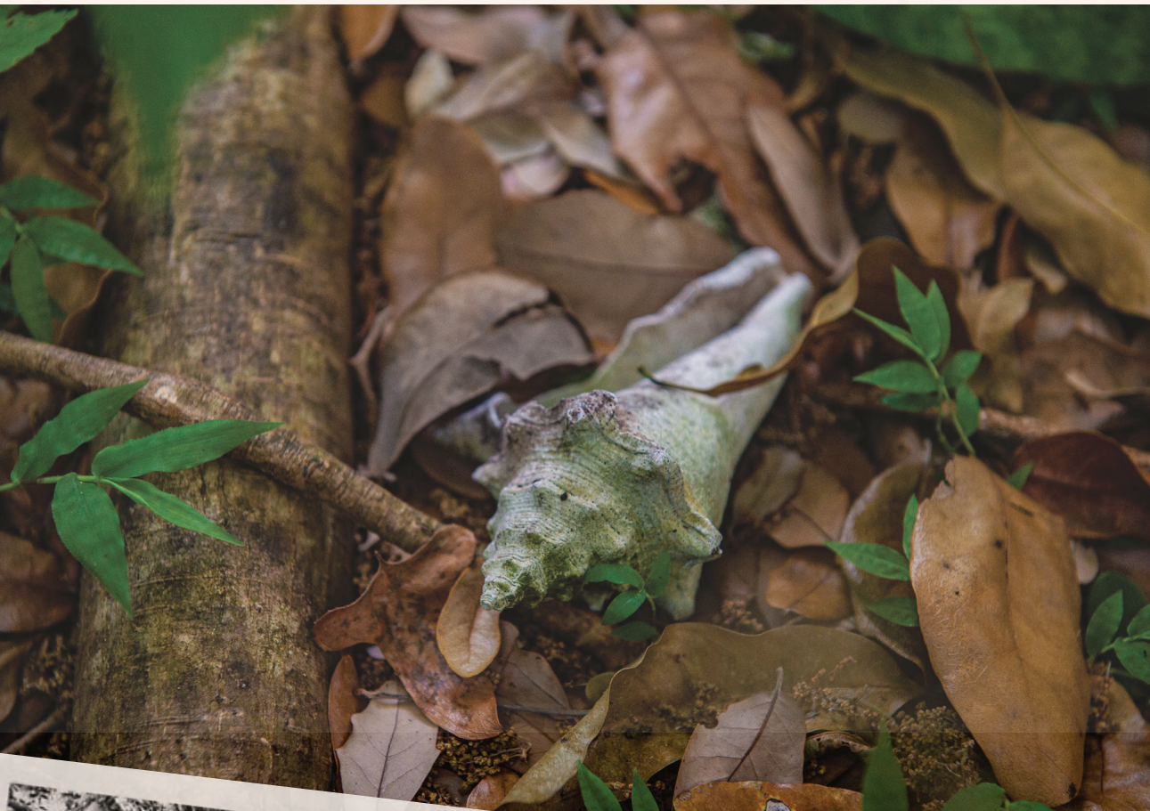
▲ Atizana ak zouti kokiyaj lanbi

Sitwayen sa yo te fòme Arch Creek Trust an 1981. Konte Miami-Dade lwe tè a epi li te konstwi mize a, pandan ke Youth Conservation Corps (Y.C.C.) te konstwi santye natirèl. Pak la te louvri ofisyèlman nan mwa avril 1982. Depatman Pak, Rekreyasyon ak Espas Ouvè Konte Miami-Dade - inite Miami EcoAdventures, ansanm ak Arch Creek Trust ap travay kounye a pou retabli, sipòte, ak prezève pak la.