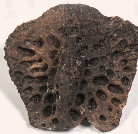
▲ Atizana ak karapas Kayiman