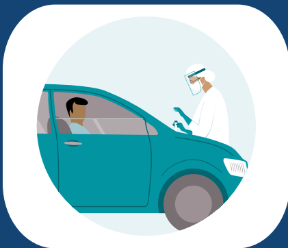
Desde los automóviles